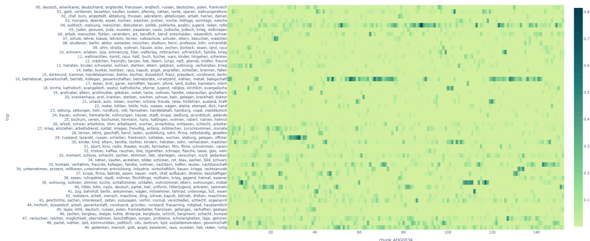
Abb. 2: Die Verlaufsmatrix zeigt die Topics anhand der ersten zehn Wörter (Y-Achse) im chronologischen Verlauf des Interviews, gegliedert nach Chunks (X-Achse). [Grafik: Dennis Möbus 2024]

Der Wunsch, direkt über die visuelle Oberfläche Muster auszuwählen und weiter zu filtern, wurde in den beiden Gruppen geäußert, die erst an Topic Models arbeiteten (A1 und A2). Das zog jedoch die Kritik eines Historikers nach sich, der anmerkte, die »Heatmap lenk[e] den Blick zwangsläufig auf Stellen, die gesuchte Inhalte thematisieren. Dabei geht verloren, was nicht angesprochen wird.« Der Verweis auf Leerstellen im Material ist jedoch kein Alleinstellungsmerkmal dieses Verfahrens und für manuelle ebenso wie für computationale Ansätze relevant. Interessant ist jedoch seine Erkenntnis, »über die Matrix erschließen sich eher die Randthemen des gesamten Korpus, die in einzelnen Interviews hervorstechen.« Somit kann Topic Modeling zwar den Blick auf die Gewichtung von Themen verzerren, hat aber Potenzial, Ausreißer zu lokalisieren, die unter dem Radar des vordergründigen Forschungsthemas einer Interviewsammlung fliegen. 41 Hier wird die Nutzung als Findeheuristik für spezifische Fragestellungen 42 besonders deutlich – was für Sekundäranalysen relevant ist und von den Forschungsinteressen der Primärforschung deutlich abweichen kann, weshalb Ausreißer interessieren.