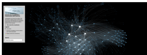
Abb. 2: Graph-Visualisierung mit Sigmajs. http://www.martingrandjean.ch/graph/ . Vgl. auch Grandjean 2014. Eine neuere Version ist unter http://www.martingrandjean.ch/icic/ abrufbar. Bei dem hier angezeigten Bild handelt es sich um ein wissenschaftliches Zitat nach §51 UrhG. Es darf nur in diesem Sinne verwendet werden; etwaige Urheberrechte sind zu beachten.

Die Visualisierung von Netzwerken kann nicht nur neue Erkenntnisse über Personen, Gruppen und ihre Beziehungen generieren, sie kann auch schön aussehen. Mit Javascript Frameworks wie Sigmajs lassen sich die Graphen wunderbar in Szene setzen. 33 Stellvertretend sei hier das Beispiel eines Netzwerks der Korrespondenz von Mitgliedern des Internationales Instituts für geistige Zusammenarbeit von 1926–1946, einer internationalen Organisation zur Förderung des wissenschaftlichen und intellektuellen Austauschs, der Vorgängerinstitution der heutigen UNESCO, präsentiert, das von Martin Grandjean aus den Daten des Archivs der UNO in Genf realisiert wurde.